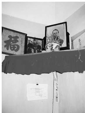
ハノイのカム・チョン宅の祭壇 (2003年2月、左：筆者、右：カム・チョン)