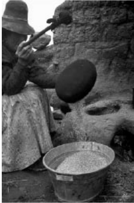
写真6 ベカーニャを用いたサポニン除去の作業