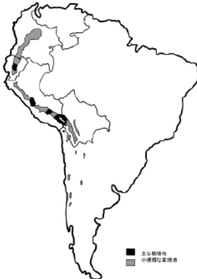
図3 キヌア栽培の分布図 (TAPIA et al. 1979より引用)