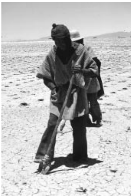
写真10 鋤を使つてのキヌアの播種

さらに、収穫後のキヌアの枝などは燃料等に使われ、残すことなく利用されており、植物資源を確保することが、いかに大切かが理解できる。