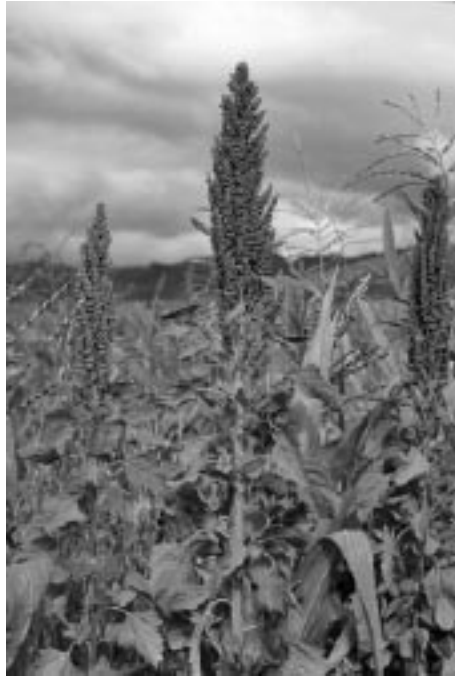
写真1 アンデス高地の雑穀, キヌア

重要なのはキヌアという穀物である」と述べている(インカ・ガルシラーソ 1986(1609): 313) 1) 。