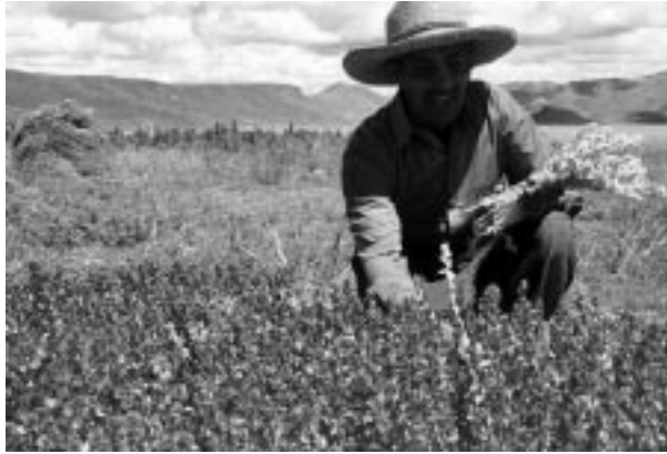
写真2 キヌアに近縁のカニワ。キヌアよりも草丈が低い