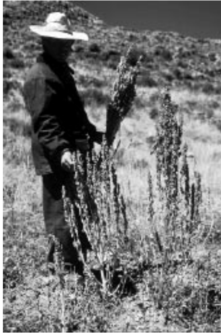
写真3 キヌアやカニワ畑に自生するアカザ属の随伴雑草