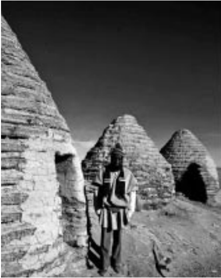
写真7 チパヤの家と男性