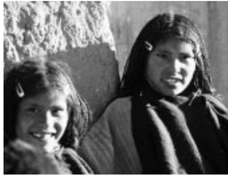
写真8 チパヤの少女。ドレッドヘアのような三つ編みが特徴

小さいものの、先述したように農業も行っている。現地で聞きえた情報によれば、ルキとよばれるジャガイモも栽培されるが、圧倒的に重要な作物はキヌアだとされる。実際に、私たちが同地を訪れた2003年もキヌアだけが栽培されていた。以下では、このキヌアの栽培方法について報告する。