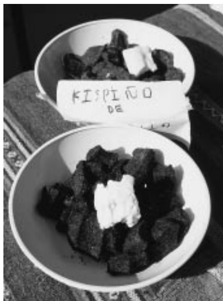
写真4 雑草種で作る練り団子

ところで、先述したように、キヌア、カニワ、そしてアカザ属の随伴雑草はいずれも種子の表面に植物毒の一種であるサポニンが付着している。したがって、これらの種子を利用するためにはサポニンの除去が欠かせない。一般に、植物の栽培化では有毒のものから無毒への変化が見られるが、キヌアもカニワも栽培植物でありながら、その種子は有毒なのである。それでは、このサポニンをどのようにして毒抜きしているのか、それを私たちの観察結果から報告しよう。