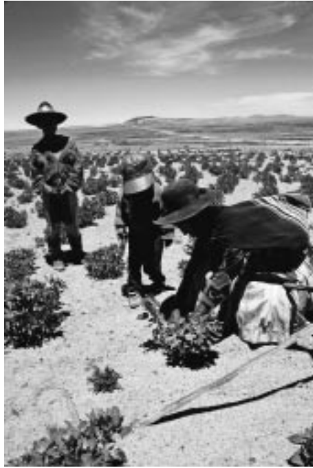
写真9 コイパサ近くのキヌア畑。きわめて乾燥した 様子がうかがえる。なお、この女性はチパヤ ではなくアイマラ族

プフ (puju) という水路をつくる。この作業は、親族集団で行われる。こうした状態を二ヶ月間保つことで、水草が発生し、これを有機質肥料として利用しているという。