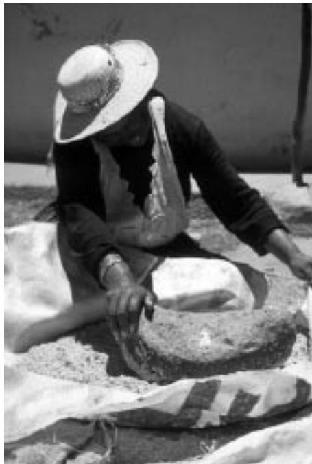
写真5 カニワを煎り、種子表面を取り除く作業

キヌアを大量に処理する場合、手で洗うためには大変な労力を要するため、ペカーニャという三日月型の大きな石を臼として用いる（写真5）。すなわち、キヌアの種子を水で濡らしたあと、ペカーニャの弧の部分の下部をキヌアの種実にしごき当てる、左右に揺する。こうして、種実をしごくように、20分くらいこすってサポニンを落とす。キヌアを水で洗ったあと、この作業を最低3回程度繰り返す。石がない場合は、足のかかどを使って、同様の方法でサポニンを落とすこともある。水洗いしたキヌアは、1日天日干ししてから保存する。このためサポニンを落とすためには、朝早くから夕方日が落ち