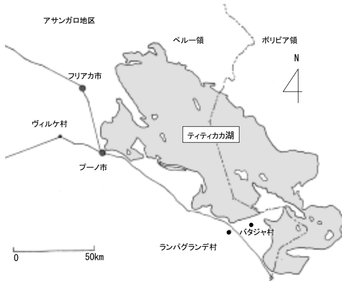
図2 ティティカカ湖周辺および調査地の地図