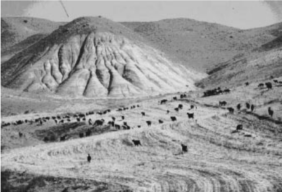
写真1 コムギ収穫跡地でのヤギの放牧。イランのアルボルツ山脈西部、標高1,500メートルのマーネシャーンという町郊外で、コムギを収穫した後にヤギの群れを放牧。厳しい乾季の9月上旬、家畜の餌は非常に少ない。

構成されている。ひとつは、沖積土の厚く堆積したワディとその斜面。もうひとつは、ワディの縁辺から立ち上がる急峻な砂岩質の岩山である。いうまでもなく、前者がコムギ・オオムギの領域、後者がヤギの領域である。写真1は、コムギを収穫した跡地にヤギを放牧している写真を示している。イランのアルボルツ山脈西部、標高1,500メートルのマーネシャーンという町の郊外で見た光景である。ベイダとよく似ていて、手前に緩やかな斜面が広がり、そこでコムギが栽培されていた。その後ろに砂岩の壁がある。イランの9月上旬は厳しい乾季の真最中であり、家畜にとって非常に餌が少なくなる時期である。このような時期に、コムギ畑に残っているムギワラと、わずかではあるがコムギの子実も落ちており、ヤギ達はゆっくり移動しながらムギワラと落穂を食べていた。