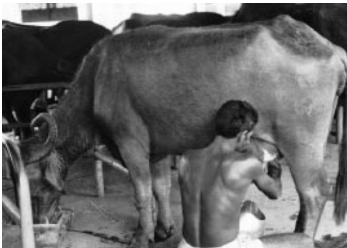
写真2 スイギュウの乳用品種ムラーの搾乳

スイギュウの分布に見られる大きな特徴は、2種類のスイギュウが明確に分離できることである。中国から東南アジアにかけての稲作地帯に分布するスイギュウは、主として役用に使われるスワンプ型（沼沢型）スイギュウであるのに対し、インド以西に分布するスイギュウは、乳用の目的にも利用されるリバー型（河川型）スイギュウである（金