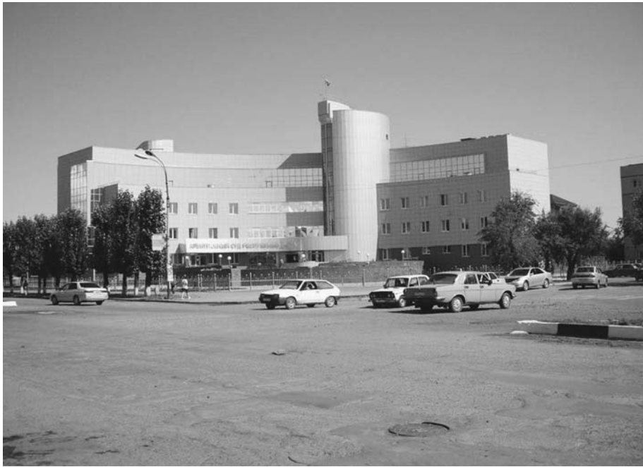
Здание Арбитражного суда, 2009 г.