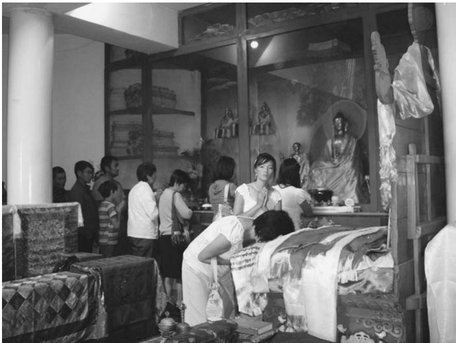
В буддийском храме, 2009 г.