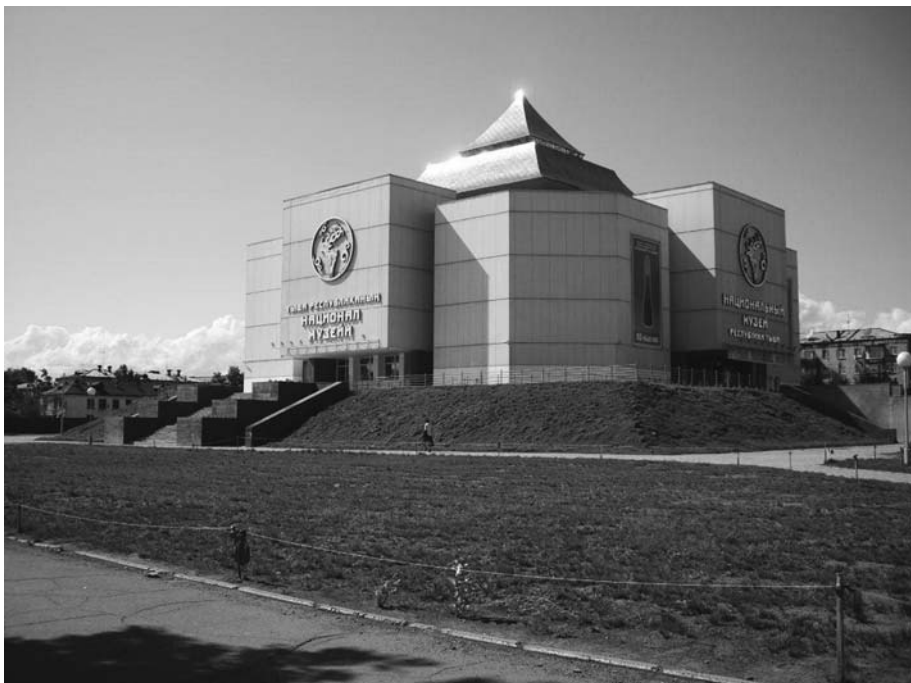
Национальный музей Республики Тува, 2010 г.