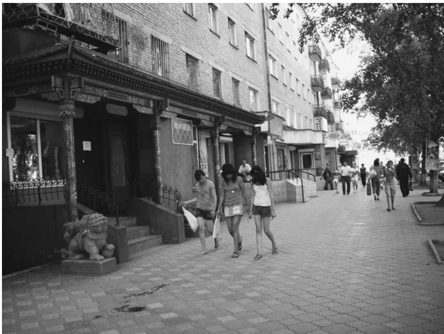
На улице Кызыла.