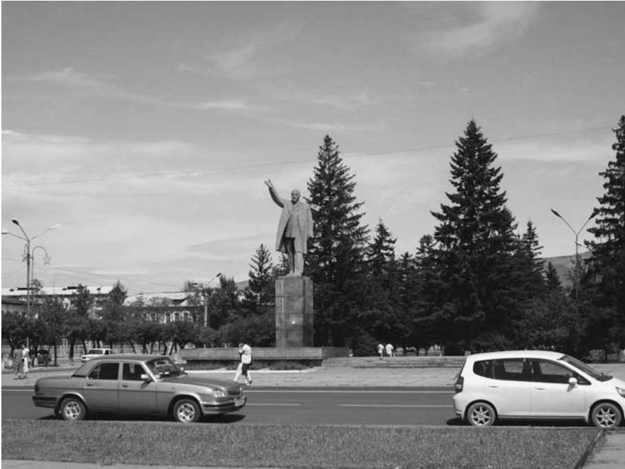
Социализм рухнул, а Ленин остался.