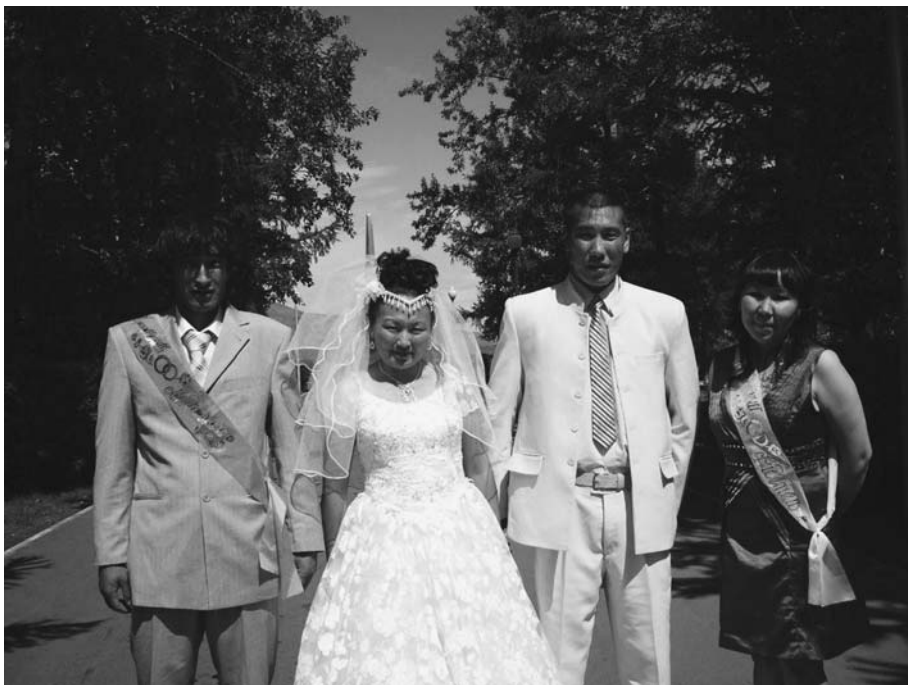
Современная свадебная церемония.