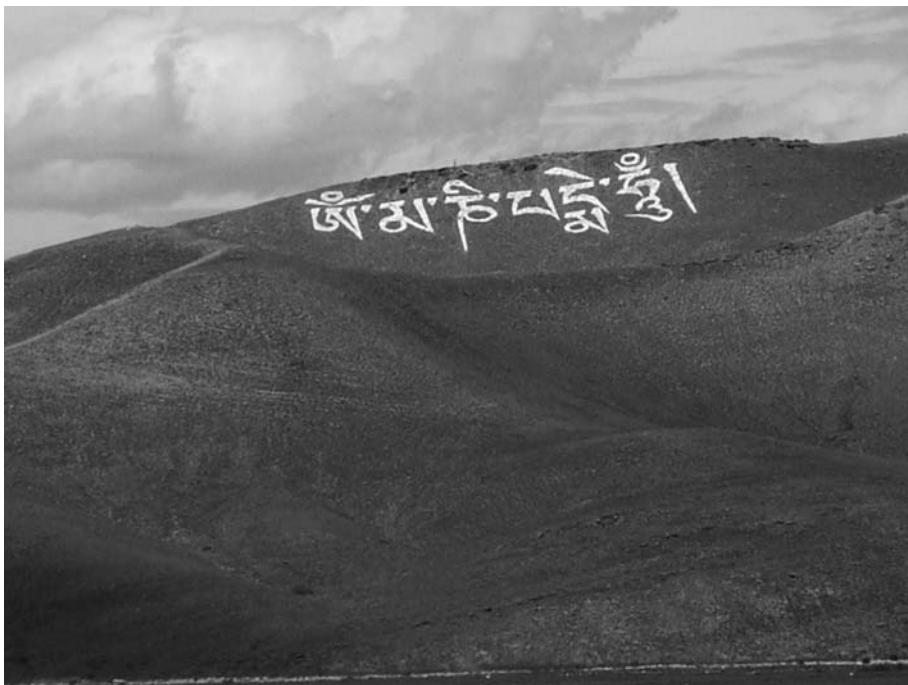
Буддийская мантра Ом мани падме хум, сложенная из камней.