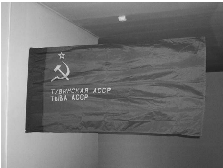
Флаг Советской Тувы.