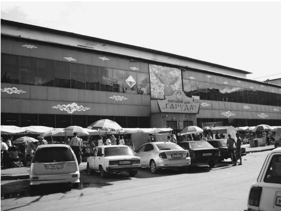
Торговый центр в Кызыле