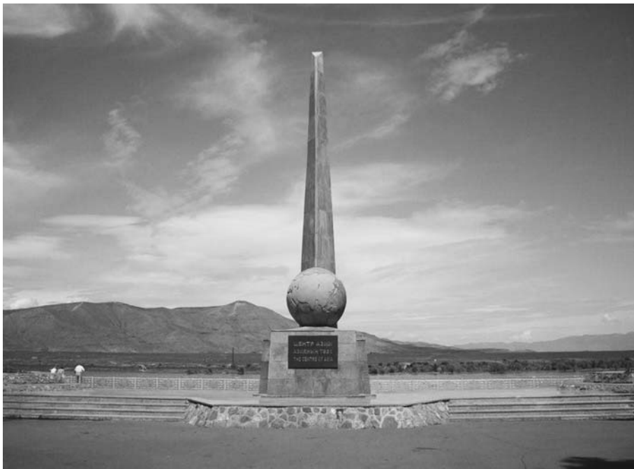
Обелиск Центр Азии