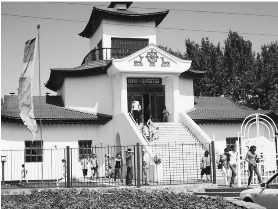
Главный буддийский храм в Кызыле.