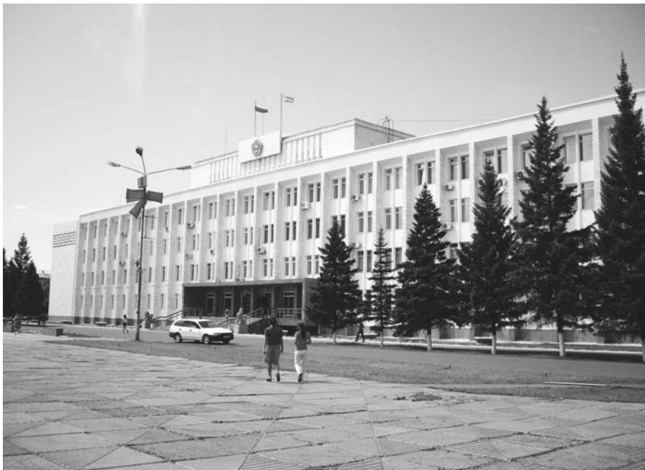
Белый дом в Кызыле, 2010 г.