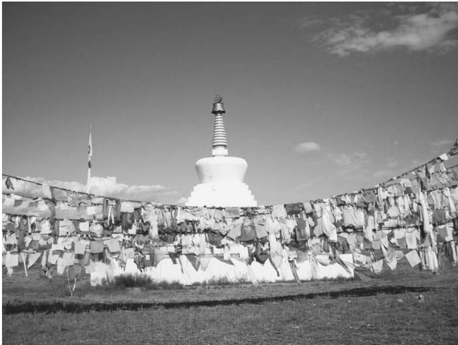
Новый субурган, 2010 г.