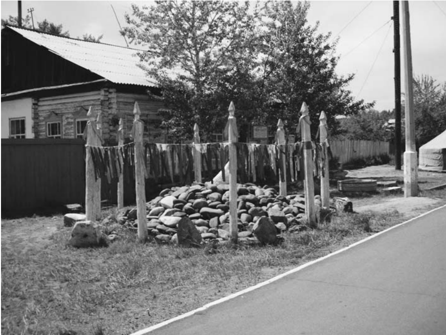
Оваа около шаманской клиники