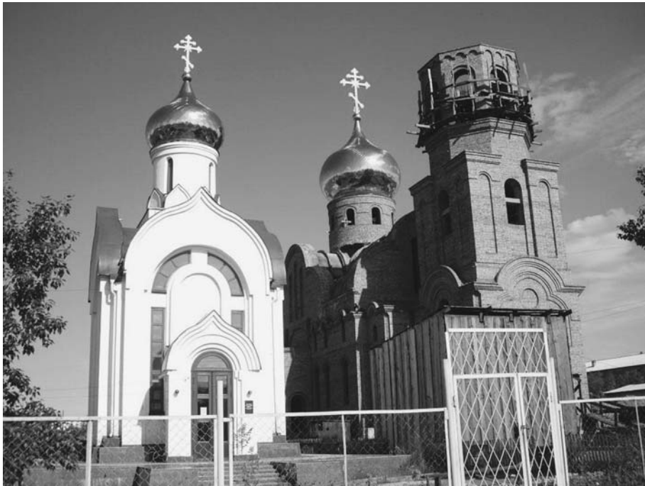
Новая православная церковь в Кызыле