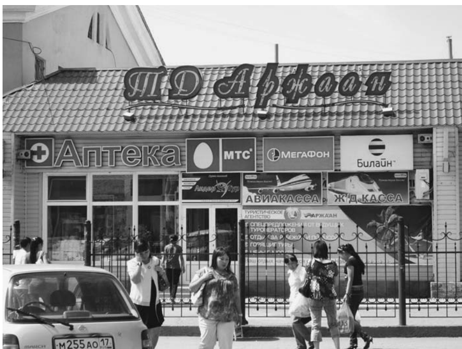
МТС, Билайн и Мегафон связывают Туву со всем миром, 2010 г.