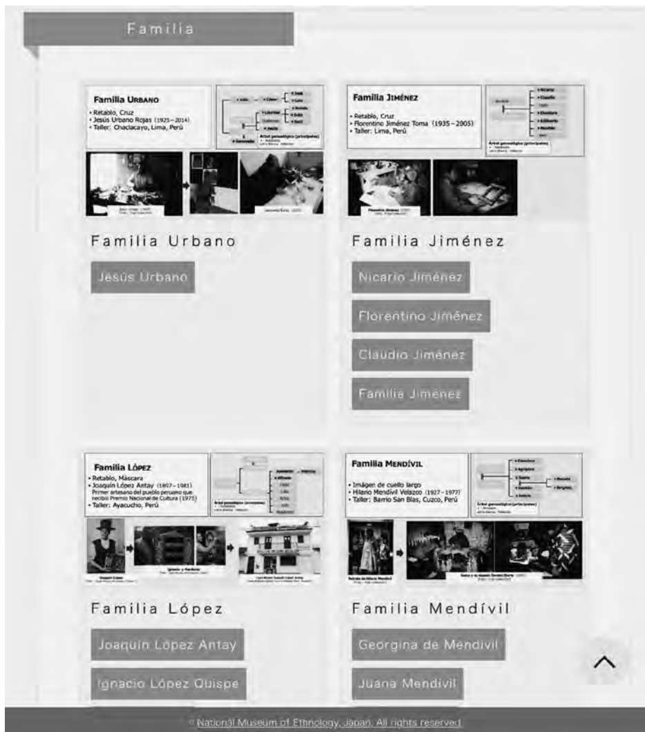
Foto 3 La página muestra la evolución de cada familia de grandes maestros en el archivo fotográfico realizado por el programa de “Info-Forum Museum”.

En este programa todavía quedan algunos detalles para optimizar el entendimiento sobre los trabajos de cada maestro, por lo que se necesita revisar las obras que están