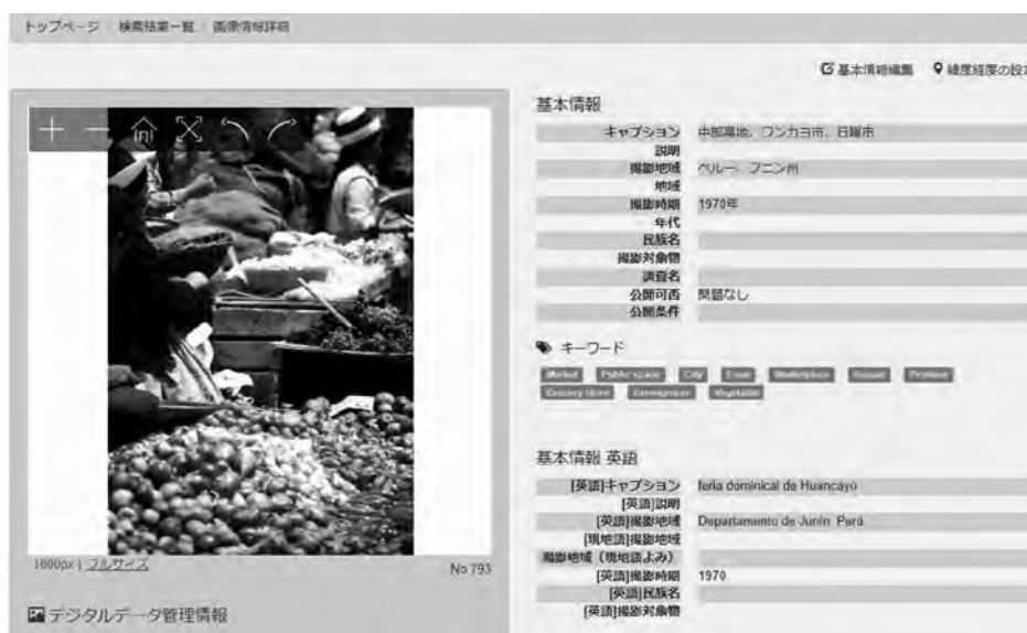
Foto 1 Una página del archivo fotográfico de Fujii establecido por el Minpaku (una escena de la feria dominical en Huancayo). En la parte central de la información aparecen unas palabras claves (en inglés: Market, Public space, City, Food, Marketplace, Bazaar, Produce, Grocery store, Greengrocer, Vegetable), las cuales se han reconocido automáticamente por el sistema de IA.

Ambas colecciones de imágenes fotográficas indudablemente son muy valiosas,