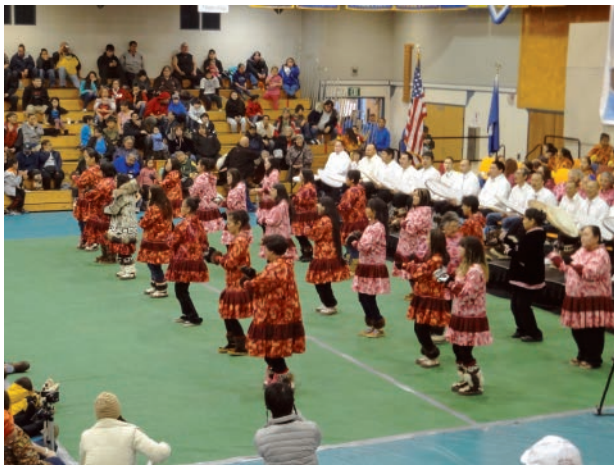
アラスカ先住民イヌピアットのドラムダンス（2013年2月、パロー村）。

と京都大学で教授を務めた宮岡伯人は環北太平洋の各地の先住民社会に多くの若手研究者を派遣し、言語調査をさせた。また、民博の大塚和義は、2001年に佐々木史郎（当時民博、現国立アイヌ民族博物館）と筆者とともに北太平洋先住民の交易とそれに関連する先住民儀礼・工芸の隆盛に関する特別展「ラッコとガラス玉」を民博にて開催した。