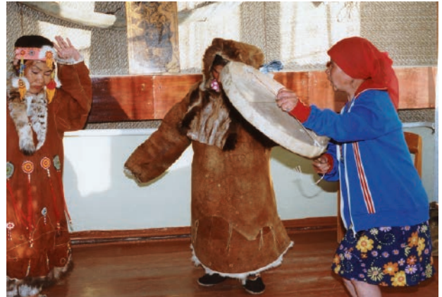
カムチャツカ半島先住民コリャークのドラムダンス（1994年7月）。

人間文化研究機構理事、国立民族学博物館学術資源研究開発センター教授（併任）。専門は文化人類学。編著書に『捕鯨と反捕鯨のあいだに—世界の現場と政治・倫理的問題』（臨川書店 2020年）や『世界の捕鯨文化—現状・歴史・地域性』（国立民族学博物館調査報告SER149）（2019年）、『捕鯨の文化人類学』（成山堂書店 2012年）などがある。