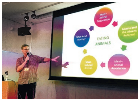
ジョン・ナイトの発表風景。公開共同研究会として開催したので、一般からも多くの参加があった(2017年7月29日撮影)。

昨年度の研究会では、獣肉消費の倫理的側面についても検討が行なわれた。ジョン・ナイト(クイーンズ大学ベルファスト校)は、食肉における「不在の指示物」をめぐるフェミニスト作家キャロル・アダムスの議論(Adams 2003)を頼りとしながら、「肉と動物のつながり」を論じた。近代的な食肉産業においては、肉と動物の間のつながりは隠蔽されている。「肉と動物のつながり」の様態が、新肉食運動や狩猟の匿名性をめぐる事例などから考察された。肉と動物の関係は、「肉と動物のつながりが全く意識されない」状態から、「人が肉となった動物の個体と継続的な個人的な関係を有し、肉と動物のつながりが最大限意識されている」状態まで、連続性を有している。