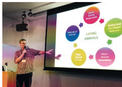
ジョン・ナイトの発表風景。公開共同研究会として開催したので、一般からも多くの参加があった(2017年7月29日撮影)。

昨年度の研究会では、獣肉消費の倫理的側面についても検討が行なわれた。ジョン・ナイト(クイーンズ大学ベルファスト校)は、食肉における「不在の指示物」をめぐるフェミニスト作家キャロル・アダムスの議論(Adams 2003)を頼りとしながら、「肉と動物のつながり」を論じた。近代的な食肉産業においては、肉と動物の間のつながりは隠蔽されている。「肉と動物のつながり」の様態が、新肉食運動や狩猟の匿名性をめぐる事例などから考察された。肉と動物の関係は、「肉と動物のつながりが全く意識されない」状態から、「人が肉となった動物の個体と継続的な個人的な関係を有し、肉と動物のつながりが最大限意識されている」状態まで、連続性を有している。