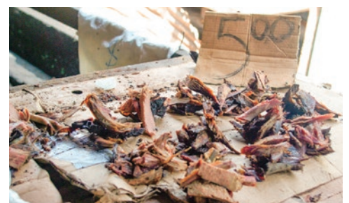
ブラザビルの市場では、燻製獣肉はごく僅かな量ずつ売られる。レイヨウ(アンテロープ)の肉が数かけらで1山500FCFA(約100円)(2011年10月19日撮影)。