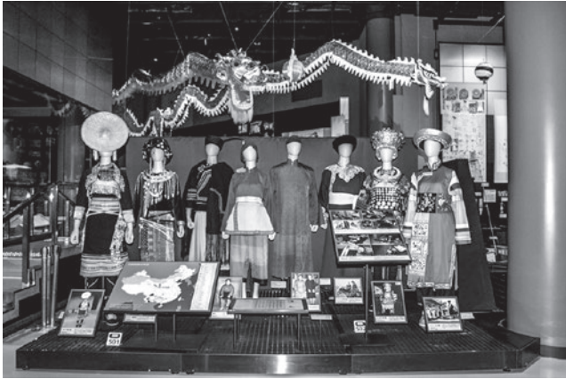
中国展示場入り口左手の展示(2016年6月)。

基幹研究 ● 中国地域の文化展示のフォーラム型情報ミュージアムの構築 (2016-2017年度)