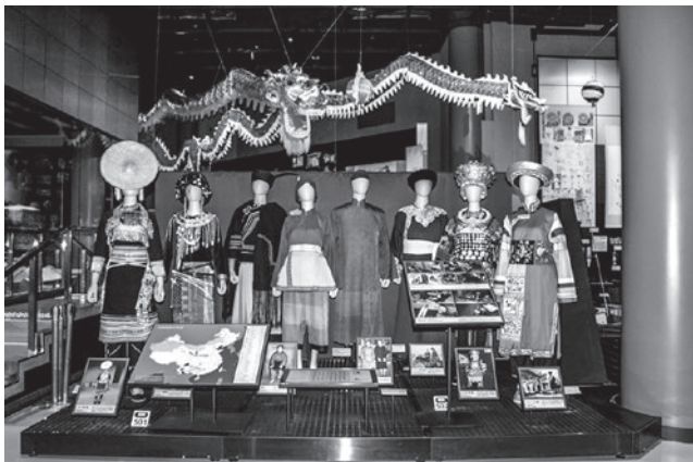
中国展示場入り口左手の展示(2016年6月、横山廣子撮影)。

基幹研究 ● 中国地域の文化展示のフォーラム型情報ミュージアムの構築 (2016-2017年度)