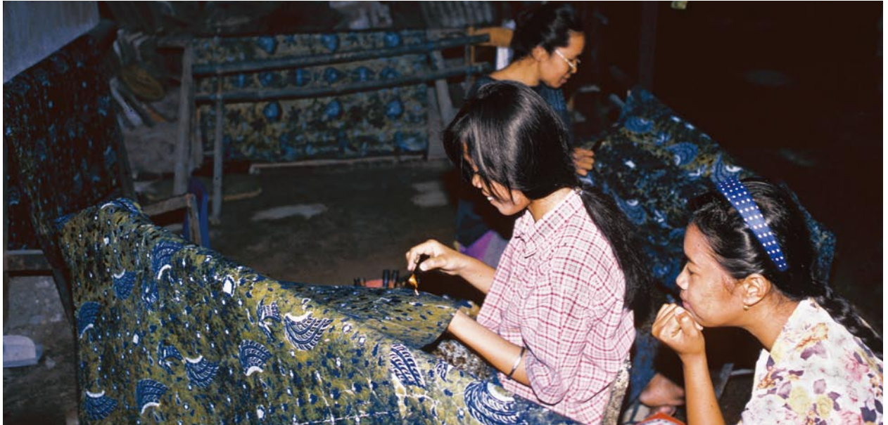
手描きパティックの工房で蠟描きをする女性たち(インドネシア)。

機関研究 ● 「マテリアリティの人間学」領域 布と人間の人類学的研究 (2010-2012)