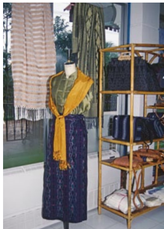
首都の女性会館にある工芸品展示場(ラオス)。

プロジェクト「モノの崇拜」と共に、モノと人との相互関係を考察する。その考察の媒体としてとりあげるのは「布-人」の相互関係である。メンバーはこれまでいずれも、アジアの各地で伝統染織や関連する工芸の研究を行い、個々に研究成果を発表してきた。これらを総合し、布から出発してモノと人の関係を論ずる新たな人類学的領域を築くことに、このプロジェクトの目的がある。布の生産、流通、消費の諸事例を、過去からのつながりや変化に注意しつつ比較検討し、人の身体性、環境規定性、実践的・状況的知識、地域性、人-モノ-人のネットワークなどについて、新しく具体的な知見を生み出すことが目標である。そこでは、人とモノを峻別せず、人自体が物質性・肉体性に根ざしていることに着目する。過剰な人間中心主義、精神や理性の中心主義を批判し、モノと人が相互浸透し融合する世界を描き出すこと、ここに大きな目的がある。