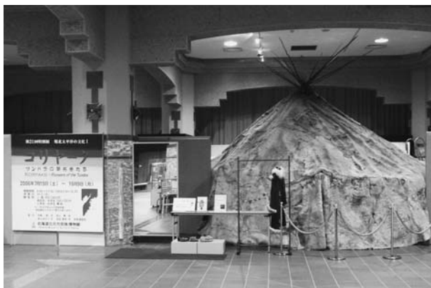
фиг. 1 Экспонаты в 21-й выставке «Коряки: пионеры тундры».