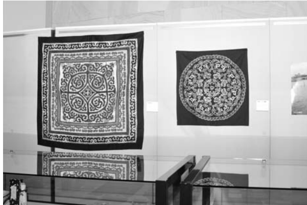
фиг. 4 Экспонаты в 26-й выставке «Уйльта и их соседи: Сахалин, Амур и Япония: градация взаимоотношений».