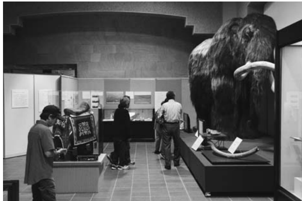
фиг. 5 Экспонаты в 27-й выставке «Республика Саха Восточной Сибири: жизнь на вечной мерзлоте».