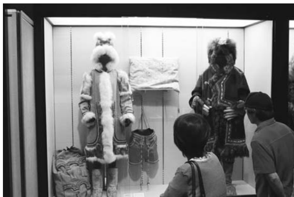
фиг. 6 Экспонаты в 27-й выставке «Республика Саха Восточной Сибири: жизнь на вечной мерзлоте».