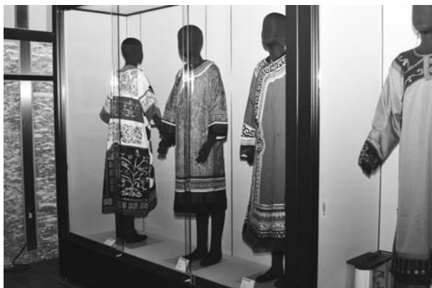
фиг. 3 Экспонаты в 26-й выставке «Уйльта и их соседи: Сахалин, Амур и Япония: градация взаимоотношений».