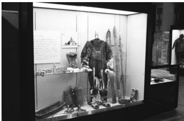
фиг. 2 Экспонаты в 21-й выставке «Коряки: пионеры тундры».