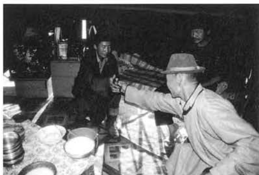
挨拶しながら、嗅ぎたばこ入れを交差するようにして交換する。

を低くして近づき、あるいは片膝をついて、フルグを謙虚な態度と面持ちで差し出す。相手も軽く左手を右肘に添えるようにしながら、右手の指先の方でフルグを持ち、握手をするように相手の右手と合わせ、自分のフルグは相手の手の平に残し、相手のフルグをつかみ取るように受け取る。フルグが二人の手の中でくりとすり替わるように見えるが、そうではなく、手を合わす時にフルグ同士は交差し、受け取るフルグを越えて相手の手の平に置くのである。年少者が右手を若干、下方で、手の平を受け取るように少し上を向け、年長者は相手の手の平の上の方から、相手の手の掌の方へフルグを置くようにする。フルグがコチコチと触れ合う音がする。そして、右手から左手に持ち替え、互いが右手で互いのフルグから嗅ぎたばこを適量、左指にとり、吸いあう。蓋の隙間からおいを嗅ぐだけの場合もある。嗅ぎ合いが済むと、同様な作法でフルグを返す。返した後で、指にとった嗅ぎたばこを鼻孔にこすりつけるようにして、吸い込むこともある。交換し終えたあとで、自分のフルグからた