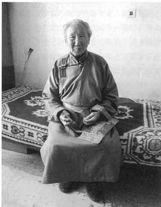
民族服デール姿で嗅ぎたばこ入れを持つ。左手は親指と人指し指で嗅ぎたばこをつまんでいる。左太ももには嗅ぎたばこ入れ用の袋がのっている。

92年の民主化以降、政府の庁舎内で民族服を着た国会議員等が正月の祝いを始め、挨拶の際、嗅ぎたばこが登場している。嗅ぎたばこ復活の象徴的なシーンである。そして、こうした風景がテレビで映し出されて、国民の間に広まっていく。それがあまりに華美に、ぜいたくに見えるようになったということで、今年の正月から政府庁舎内での祝いを中止したほどである。