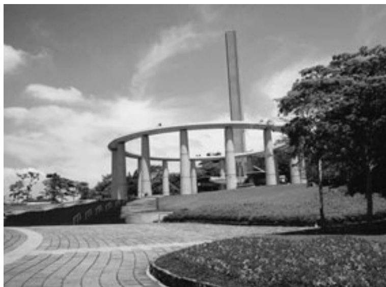
写真3 世界救世教ブラジル聖地の光の塔

にも参道を歩いているような雰囲気です。やはり聖地というのは奥にあって、高いところにあるという感覚で、駐車場から参拝者はずっと歩いて、なだらかなこの坂を通り、そして両脇に滝を見ながら目的地の光の塔へ行きます（写真4）。