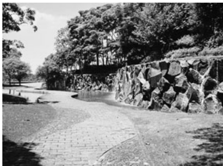
写真4 世界救世教ブラジル聖地の参道と滝