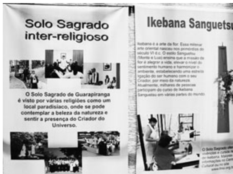
写真6 聖地と宗教・宗派間に関する展示