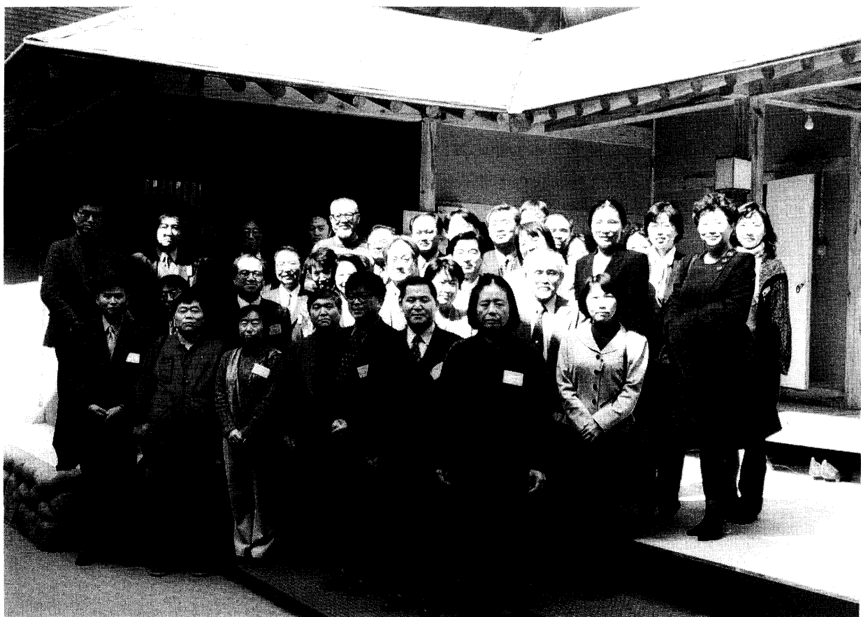
出席者記念写真（酒幕にて）