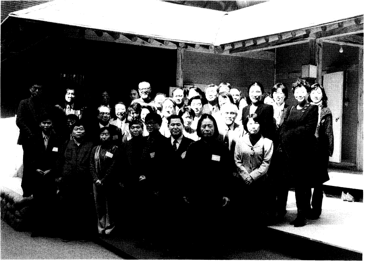
出席者記念写真（酒幕にて）