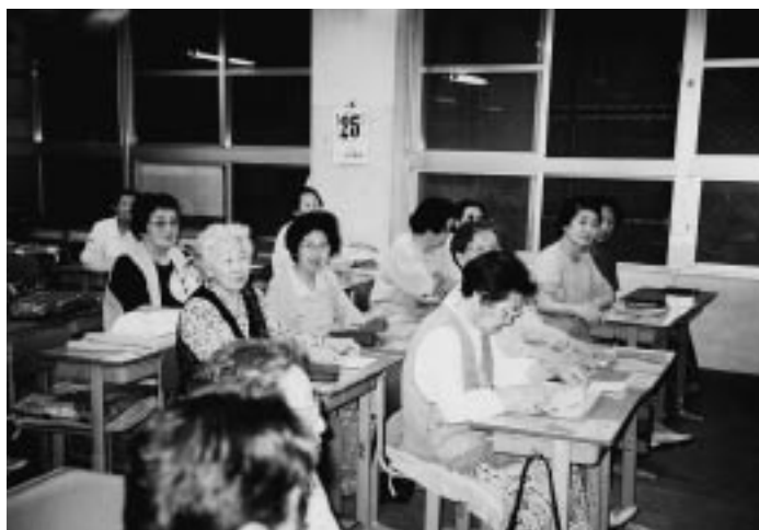
写真7 夜間学校で（中央左側）

今回の多民族展示では、東大阪市立太平寺中学校夜間学級から大々的な協力をいただいた。戦後の混乱期に義務教育未修者に教育の機会を与えるため設置された夜間中学校は、外国人出身者にもその門戸が開かれ、多くの在日コリアン一世が在籍している。仕事を引退した一世にとって夜間中学校はいろんな意味をもつ公的空間である。なにより、学校教育をうける機会に恵まれなかった一世にとって、夜間中学は日本の法制度で保障された教育に接する場所であり、実際、読み書き能力を身につける実践的な場所でもある。加えて、家事や仕事から引退してある程度生活の時間が確保できた一世にとっ