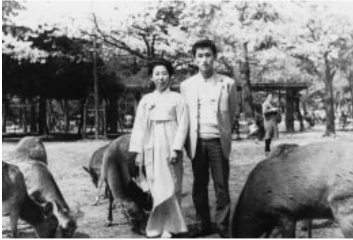
写真6 成長した息子と一緒に